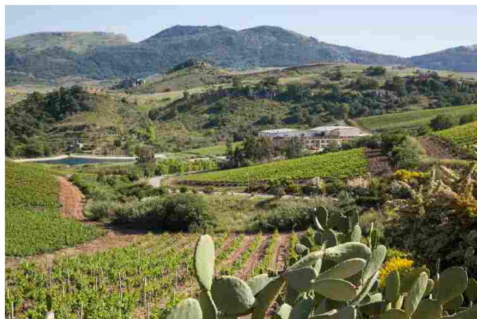
Vino, Baglio di Pianetto, i Marzotto puntano sulla sostenibilità

Il Baglio di Pianetto è una realtà nata nel 1997 e fondata dal Conte Paolo Marzotto